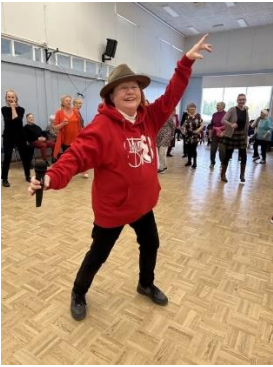
8.10 Discoiltiin Ruskon kunnan järjestämässä Mummodiscossa