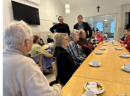
9.10 Teatteri Rollon Harmaat pantterit teatteriesitys